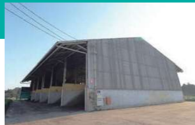
H 製品堆肥倉庫(出荷)

さらに需要先の要望に応えるべく、篩機(トロンメル)で粒径10mm以下の製品(堆肥)も製造しています。