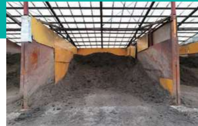
B 副原料倉庫(木くず)

微生物の活性を促進するため、良質な木くずを購入し、搬入された廃棄物と混合します。