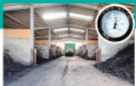
D 一次発酵槽 発酵槽では発酵環境を整えるため、エアブローにより強制発酵を促進します。これにより一次発酵では高温となり、植物に悪い影響を与える雑菌や昆虫の卵、雑草の種子を死滅させ、有機質が分解・発酵されます。