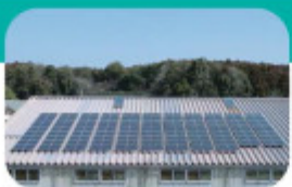
太陽光発電設備 再生可能エネルギーである太陽光発電設備の導入により、自社使用電力の削減がCO2削減に寄与しています。