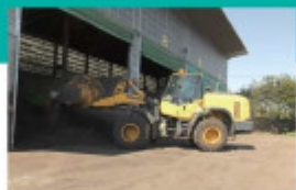
C 混合槽 微生物の発酵促進を考慮し、性状ごとに異なる廃棄物と木くず・戻し堆肥を混合し、成分や含水率を調整します。