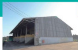
H 製品堆肥倉庫(出荷) 製品(堆肥)は需要先の要望に応えるため、粒度や熟成期間の異なる堆肥を保管しております。また製品の運搬や田畑への散布などにも対応しております。