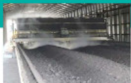
F 攪拌 (粒度調整) 完熟した堆肥は攪拌機で粒度を整え、製品として扱いやすいようにします。