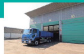
A 原料倉庫 搬入された廃棄物は品目・性状ごとに各ピットに分類保管します。