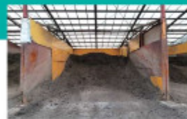
B 副原料倉庫(木くず) 微生物の活性を促進するため、良質な木くずを購入し、搬入された廃棄物と混合します。