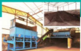
G トロンメル さらに需要先の要望に応えるべく、篩機(トロンメル)で粒径10mm以下の製品(堆肥)も製造しています。