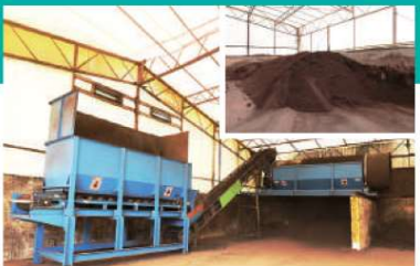
G トロンメル さらに需要先の要望に応えるべく、篩機(トロンメル)で粒径10mm以下の製品(堆肥)も製造しています。