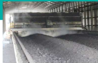
F 攪拌(粒度調整) 完熟した堆肥は攪拌機で粒度を整え、製品として扱います。