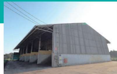
H 製品堆肥倉庫(出荷) 製品(堆肥)は需要先の要望に応えるため、粒度や熟成期間の異なる堆肥を保管しております。また製品の運搬や畑への散布などにも対応しております。