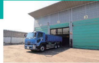
A 原料倉庫 搬入された廃棄物は品目・性状ごとに各ピットに分類保管します。