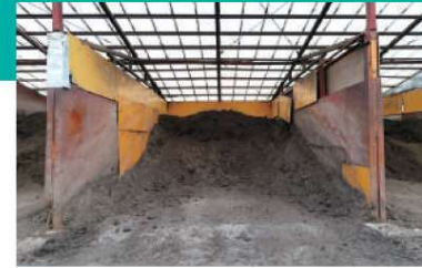
B 副原料倉庫(木くず) 微生物の活性を促進するため、良質な木くずを購入し、搬入された廃棄物と混合します。