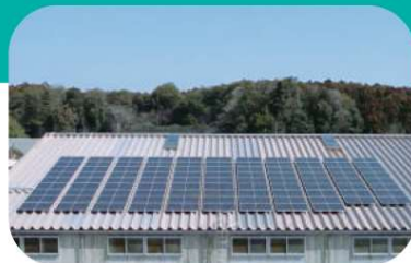
太陽光発電設備 再生可能エネルギーである太陽光発電設備の導入により、自社使用電力の削減がCO2削減に寄与しています。