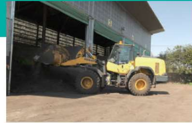
C 混合槽 微生物の発酵促進を考慮し、性状ごとに異なる廃棄物と木くず・戻し堆肥を混合し、成分や含水率を調整します。