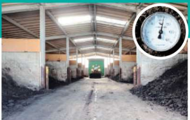
D 一次発酵槽 発酵槽では発酵環境を整えるため、エアブローにより強制発酵を促進します。これにより一次発酵では高温となり、植物に悪い影響を与える雑菌や昆虫の卵、雑草の種子を死滅させ、有機質が分解・発酵されます。