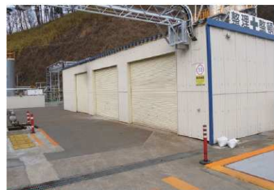
●受入棟 廃酸・廃アルカリはスクリーンで夾雑物を除去し受入、 廃油はエア駆動のポンプにて安全に受入します。

当施設は、福島県泉崎村中核工業団地に位置しております。 地域の産業廃棄物処理に寄与し、ダイオキシン類対策をはじめ、 安全と適正な処理に基づいた焼却設備により環境負荷の低減に努めています。