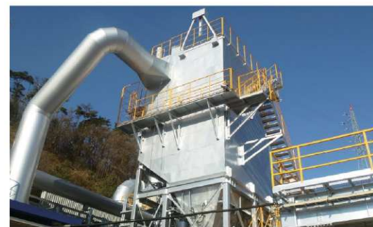
●バグフィルター ろ過による集塵方式で円筒ろ布のバグ外側から排ガスを通過させ、バグ 表面でばいじんを捕集します。バグフィルター上部には、バグで捕 集したばいじんを払い落とすための逆洗方式のバースエア装置を装 備しています。