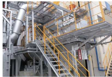
●ロータリーキルン 油泥、汚泥、廃薬塗料等を焼却します。