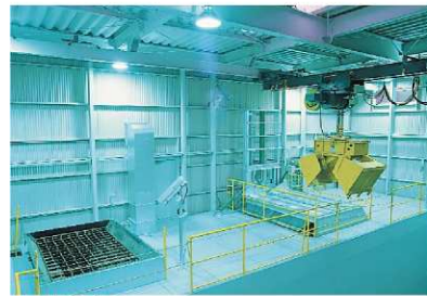
●供給クレーン 固形物ビット内の廃棄物を遠隔操作により、ロータ リーキルンあるいはストーカー炉に投入します。