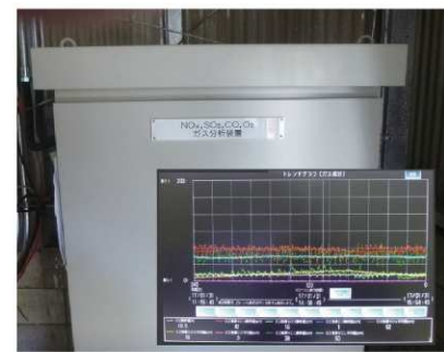
●分析計 排ガスに含まれるCO・SOx・HCL濃度を24時間 連続測定を行い、環境基準を遵守しています。