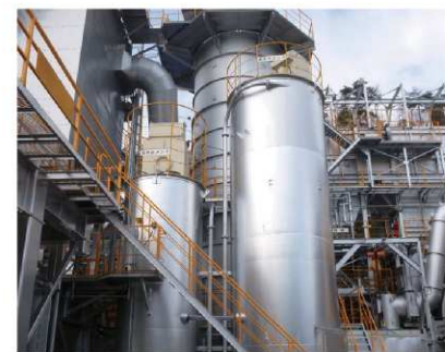
●消石灰サイロ 活性炭サイロ 消石灰、活性炭を使用することにより、排ガス中の酸 性ガス(HCL,SOx)、ダイオキシン類及び重金属の吸 着除去を行います。