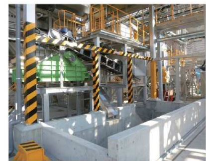
●灰ビット 焼却灰はコンベアにより集められ、路盤材等へのリサイク ル利用、または最終処分場へ搬出されます。