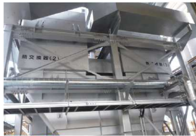
●熱交換器 二次燃焼炉の排ガスを冷却すると共に、発生する加熱 空気を煙突に送り白煙対策を講じています。