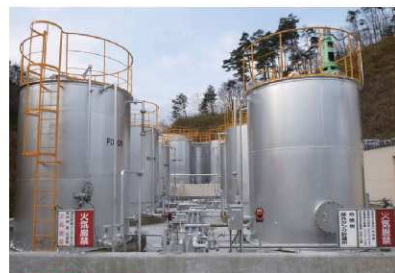
●貯留タンク 廃酸・廃アルカリのタンクは1240m 3 あり、日々の受入量 の変動に対応できます。