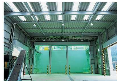
●前処理棟(固形物ビット) 固形廃棄物は必要に応じて破砕処理し、汚泥とともに それぞれ固形物ビットに貯留します。